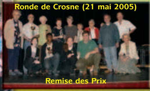
Ronde de Crosne (21 mai 2005)