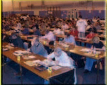
Tournoi du Perreux