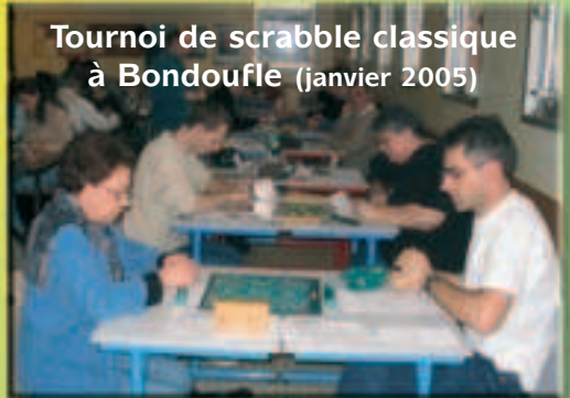
Tournoi de scrabble classique à Bondoufle (janvier 2005)

Comité Sud - Francilien de la Fédération Française de Scrabble 14 Quai d'Yonne 77130 MONTEREAU-FAULT-YONNE Tél. : 01 64 32 10 88 ou 06 80 08 56 35 (port.) Site Internet http://csffsc.free.fr E-mail : csffsc@aol.com