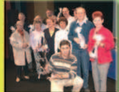
Le Comité Sud-Francilien Vainqueur du trophée Intercomités à Vichy