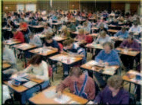
Tournoi de Savigny