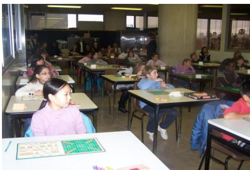
JOINVILLE, le 28 novembre 2009