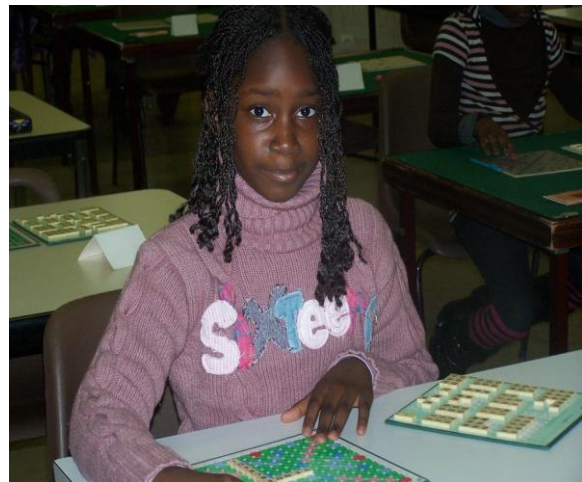
JOINVILLE, le 28 novembre 2009