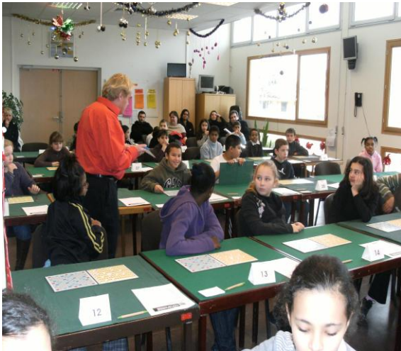
L'HAY-LES-ROSES, le 16 déc. 2009