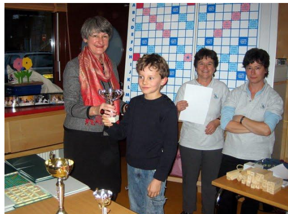
Finale sénartaise à MOISSY-CRAMAYEL, le 28 nov. 2009

Le comité Sud-Francilien de la Fédération Française de Scrabble tient à remercier tous les bénévoles qui s'impliquent tout au long de l'année pour promouvoir cette activité du Scrabble scolaire qui comporte des vertus pédagogiques désormais de plus en plus reconnues.