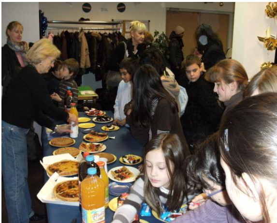
La convivialité de ces rendez-vous scolaires est toujours appréciée !