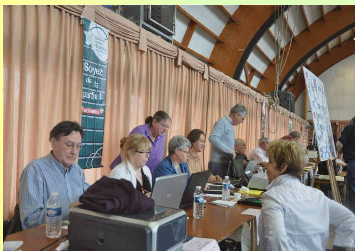
Les arbitres s'installent avec leurs ordinateurs.