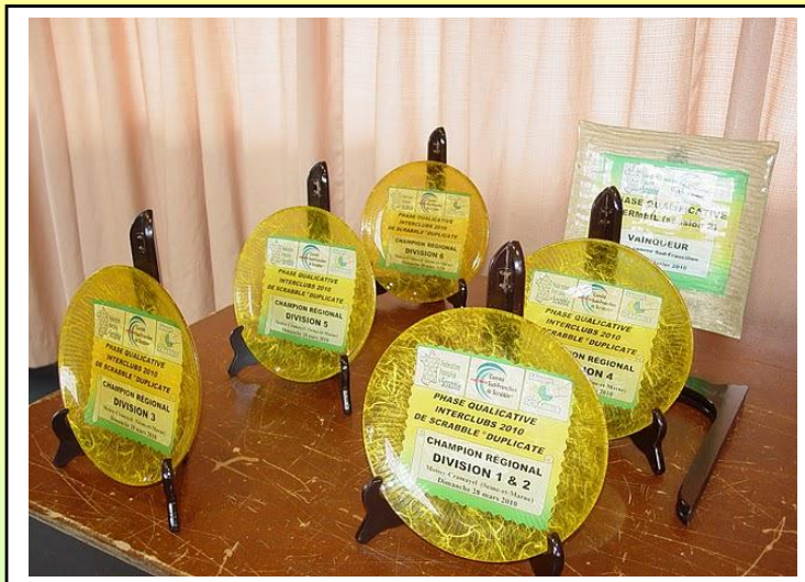
Les trophées artisanaux confectionnés par Régine LECAT attendent leur récipiendaires.