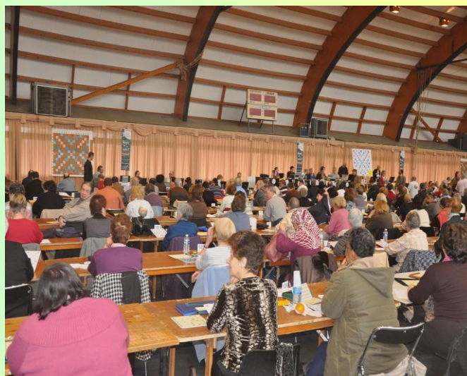
Après une bonne nuit (écourtée d'une heure !) les organisateurs sont présents à 8h pour préparer le café de bienvenue et accueillir plus de 300 personnes.

RÉSULTATS DES 53 ÉQUIPES DU COMITÉ SUD-FRANCILIEN