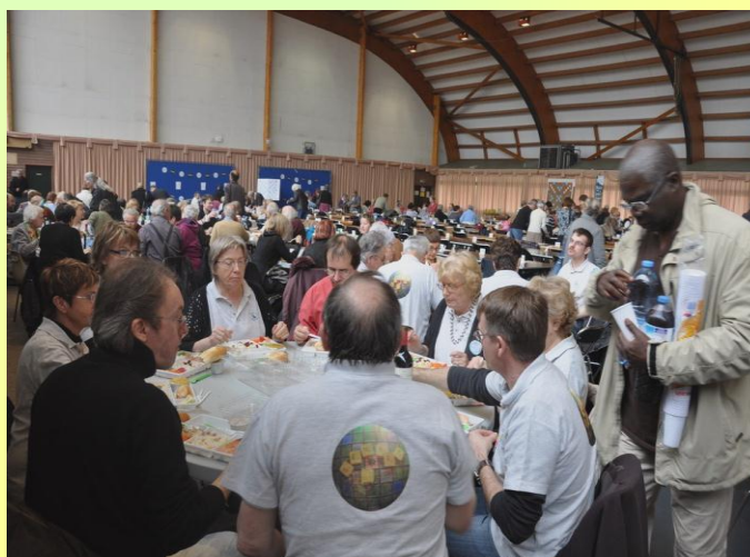
La pause déjeuner sur place a été appréciée !