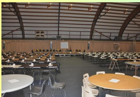
La salle du Noyer Perrot est enfin prête pour le lendemain !

RÉSULTATS DES 53 ÉQUIPES DU COMITÉ SUD-FRANCILIEN