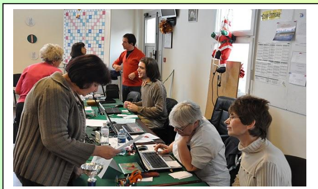
Table d'arbitrage à l'HAY-LES-ROSES.