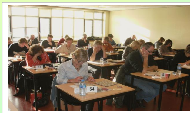
La salle de l'Espace Saint-Jean à MELUN.